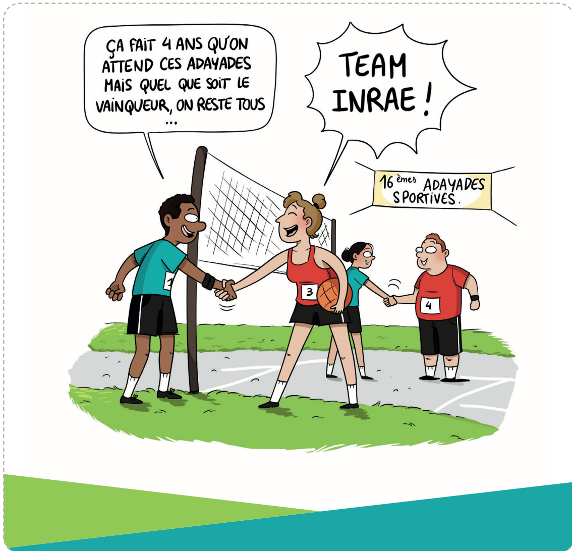
Illustration diffusée sur les réseaux sociaux et dans les centres INRAE